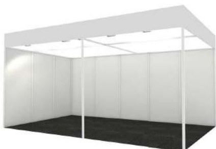
Simulación de stand modular 5x3 sin almacén